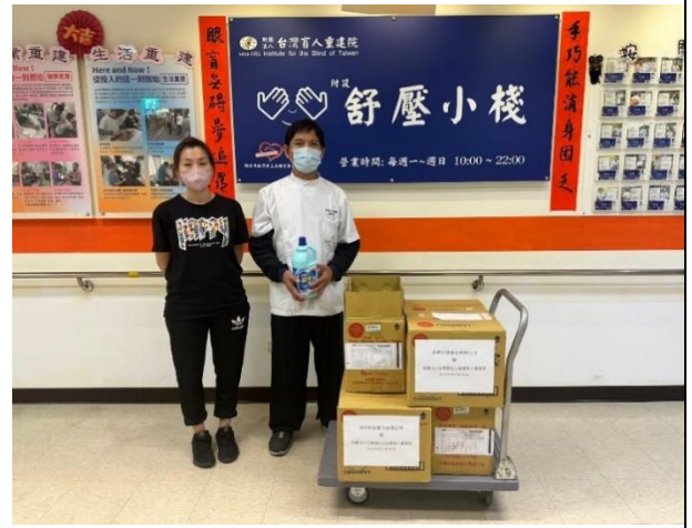
捐贈物資予台灣盲人重建院