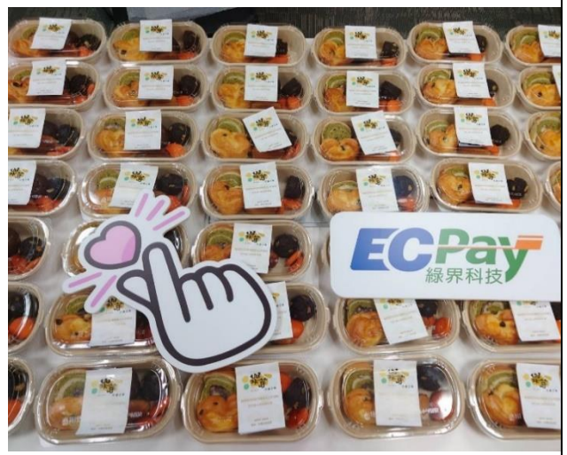
舉辦活動訂購公益餐盒，促進身心障礙者平等就業的機會