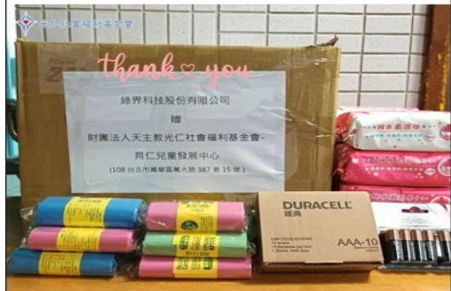
捐贈物資予光仁社福