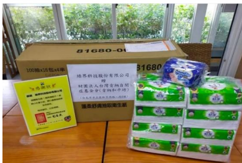
捐贈物資予財團法人台灣肯納自閉症基金會