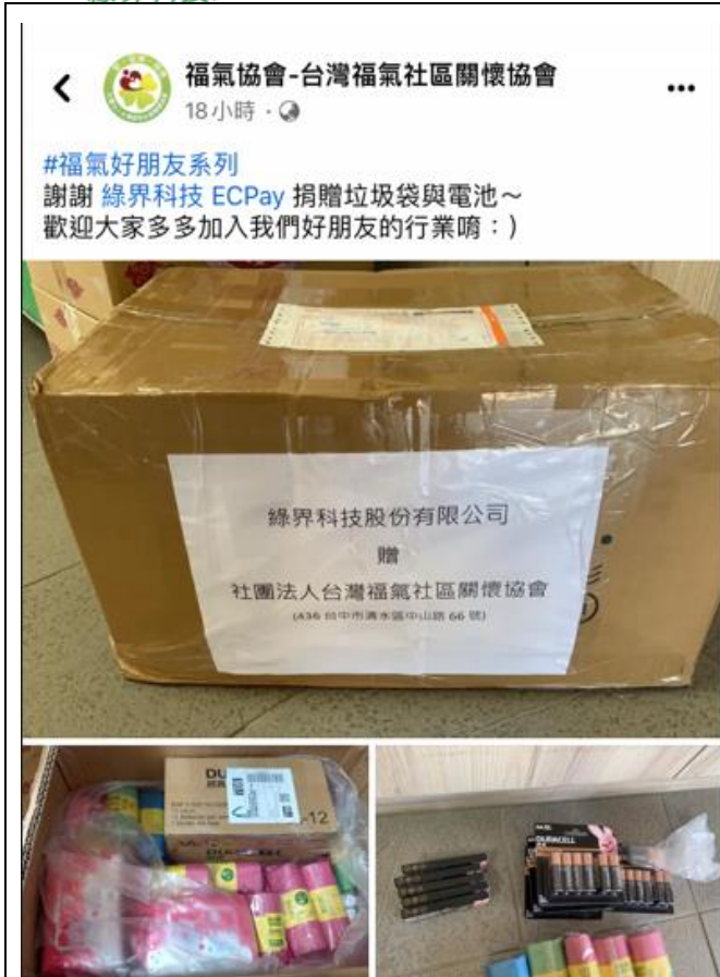
捐贈物資予台灣福氣社區關懷協會