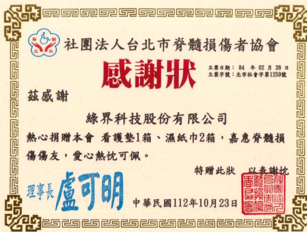
社團法人台北市脊髓損傷協會 感謝狀