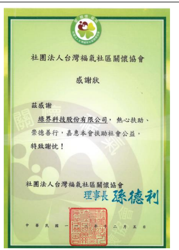
社團法人台灣福氣關懷協會 感謝狀