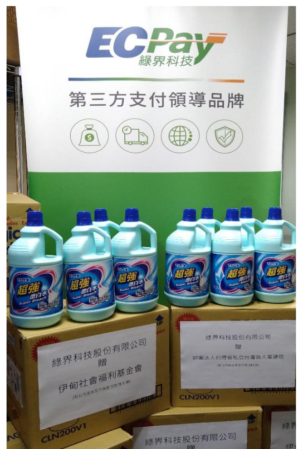
綠界科技持續關懷社區，支持公益!