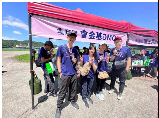
參與支持弘道老人福利基金會所舉辦的「2023 爺奶 Color Walk」公益健走活動